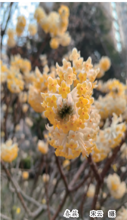
春簇 宋云 摄

电影《周恩来回延安》有一个片段令我久久难以忘怀：周总理请当年的老邻居、老朋友吃小米饭，看着老乡们捧着碗吃得那么香，想到他们生活还这么苦，他含着泪水说，“延安的小米养育了中国革命，我们欠延安的太多了。”这一幕，让我深刻理解了“江山就是人民，人民就是江山”，也切实体会到了学习习近平新时代中国特色社会主义思想领悟的根本立场——以人民为中心。