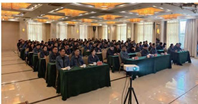
3月27日,凯实金桥公司举办第二期职工大讲堂。围绕公司“凝心聚力强冲刺,聚力融合提质效”工作主线,聚焦攻克新材料项目年底顺利投产目标,全面分析形势任务,破解发展瓶颈,进一步统一思想、凝聚共识、提振干劲。(凯实金桥 宣)

彰显铁军“硬担当”,助力高质量发展。在产改推动下,公司高素质专业化电力铁军风采充分彰显,在电网保供、应急抢修、重点项目建设等重点工作中勇挑重担。面对各类电网运维任务,职工们高效完成检修、抢修工作,全力保障电网安全稳定运行;在客户服务一线,以专业、贴心的服务解决群众用电难题,提升用电满意度;在产业发展攻坚中,主动攻坚克难,推动技术创新、管理优化,助力公司产业改革各项任务高效落地,用实际行动践行电力人的责任与担当,为区域电力可靠供应、集团产业高质量发展贡献了坚实力量。(宋云)