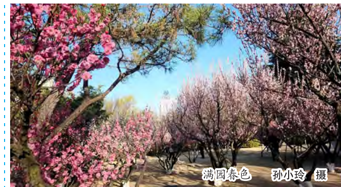
满园春色

周总理回延安的故事告诉我们，真正的政绩，不在奖杯，在口碑；不在纸上，在心上；不在眼前，在长远。在新时代的长征路上，每一名党员干部都要想清楚“政绩为谁而树、树什么样的政绩、靠什么树政绩”，认真落实集团党委“开新局夺首胜”决策部署，担当作为、攻坚克难，在新的赶考路上交出高质量发展的优异答卷。