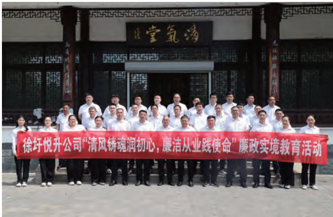
日前，徐圩悦升公司党总支组织35名党员骨干前往东海廉润晶都廉洁警示教育展馆，开展“清风铸魂润初心，廉洁从业践使命”廉政实境教育活动，进一步增强党员干部的纪律规矩意识和廉洁从业意识，引导全体党员筑牢拒腐防变思想防线。（田甜）

强化政治定位，护航企业行稳致远。牢牢锚定政治监督根本定位，从严规范党内政治生活，层层签订《全面从严治党工作责任书》，逐级压紧压实管党治党政治责任。紧扣市委“干部作风优化年”、市国资委“基础管理规范年”部署要求，深入开展作风建设大学习、大讨论、大提升活动，确保政令畅通、令行禁止，持续涵养风清气正政治生态，有力护航企业高质量稳健发展。（陈守兵）